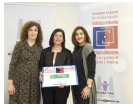
Suspergintza Elkartea desde 2007

SIMON BOLIVAR, 8B 48010 BILBAO ede@edefundazioa.org www.edefundazioa.org T. 944 009 999