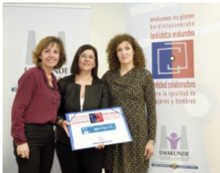
Fundación EDE desde 2004

EDE Fundazioa, tiene el distintivo que le acredita como Entidad Colaboradora en Igualdad de Oportunidades entre mujeres y hombres . Este reconocimiento fue creado en 1994 por el Gobierno Vasco, a iniciativa de Emakunde-Instituto Vasco de la Mujer, con el objetivo de reconocer a las empresas y entidades que han asumido el compromiso de avanzar en la igualdad de oportunidades entre mujeres y hombres en el seno de su organización. Además, desde febrero de 2007, EDE Fundazioa es una entidad consultora homologada por Emakunde para la prestación de asistencias técnicas a organizaciones en materia de igualdad de mujeres y hombres .